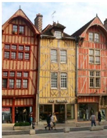
◀ Troyes et ses maisons à pans de bois

En 22-21 avant Jésus-Christ se construit la voie Agrippa qui détermine la future cité. Elle est peuplée par les Tricasses. Cette ville se développe grâce aux célèbres foires de Champagne et devient la capitale de la champagne . On voit apparaître l'artisanat comme le textile, le cuir et les métiers de construction. Les premiers métiers à bonneterie apparaissent en 1745 et donneront le titre de capitale de la bonneterie à Troyes . Son cœur historique, en forme de bouchon de champagne, nous dévoile de magnifiques maisons à pans de bois .