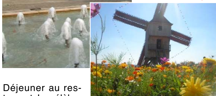
Le moulin de Dosches ▼

Déjeuner au restaurant. La célèbre andouillette AAA fait la renommée de cette ville.