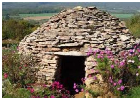
◀ Une cadole

Le bulletin d'inscription et le règlement sont à envoyer à :