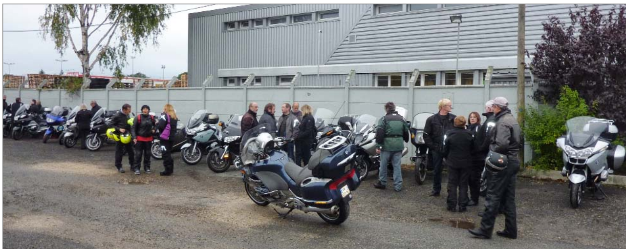
Visite de l'usine Motul p. 4