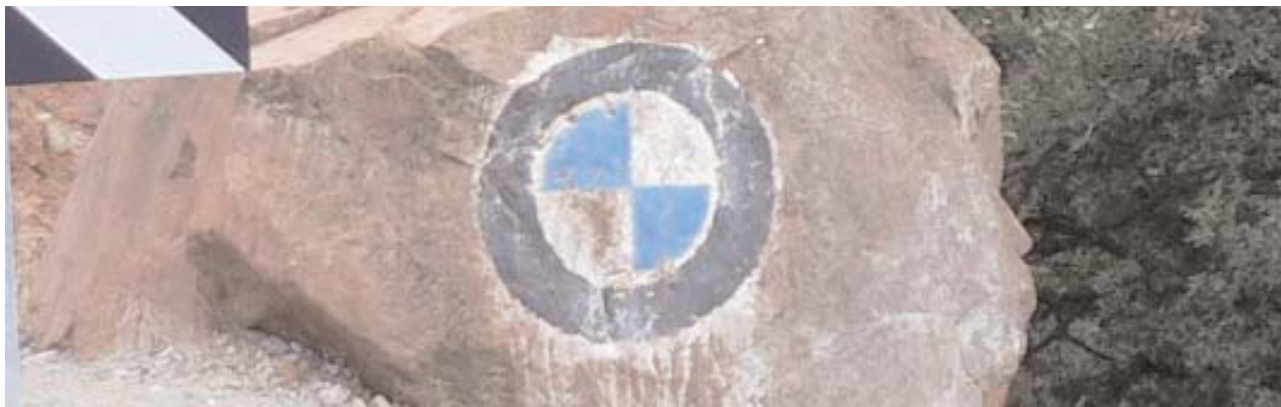
Rencontre marocaine p.5

p 2 & 3 Le Club p 4 - Infos p 5 à 7 - Tourisme p 8 - Calendrier