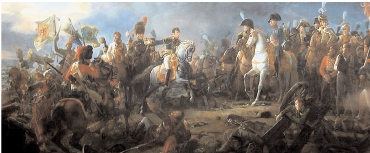
Sous le soleil d'Austerlitz p.4

p 2 - Le Club p 3 - Tourisme p 6 - Calendrier