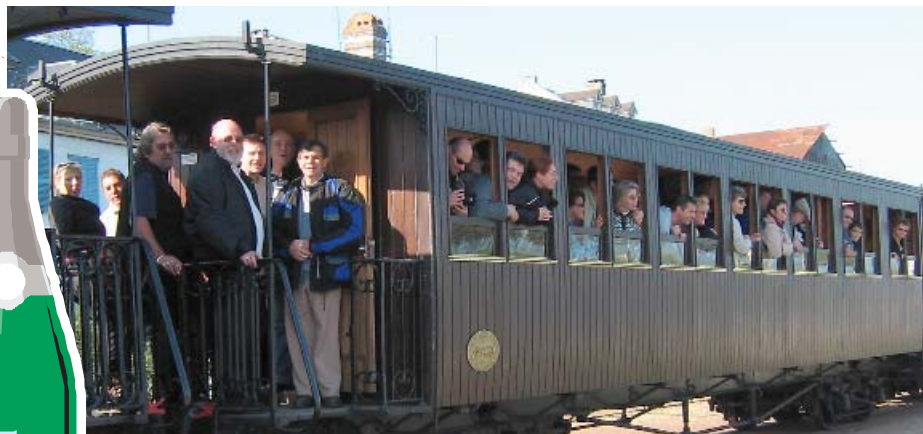
Balade d'après Salon dans la Baie de Somme - page 8