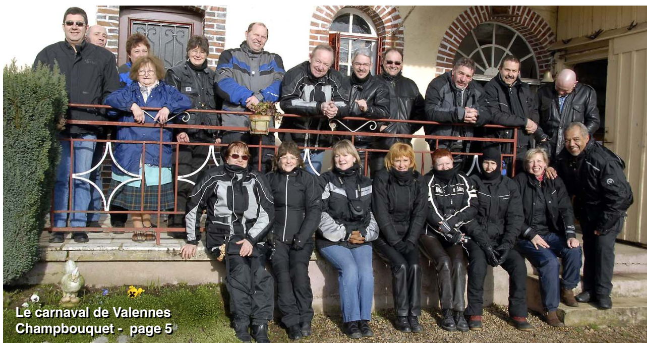
Le carnaval de Valennes Chambouquet - page 5