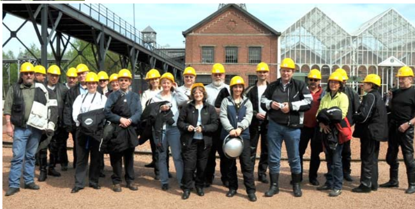
Lewarde, le 26 avril page 7