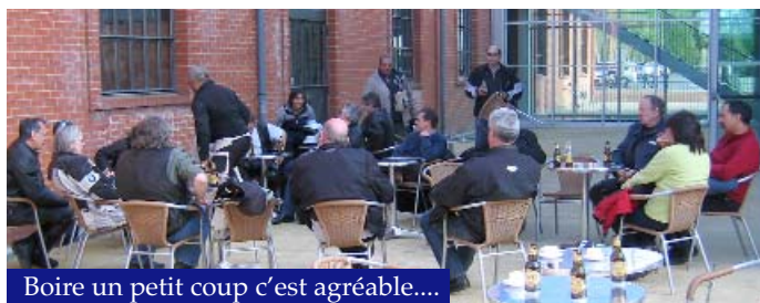
Boire un petit coup c'est agréable....

qui ont été très utilisés jusqu'au début du 20 e siècle. Pour la petite histoire, les chevaux apprenaient vite à "compter" les cha-