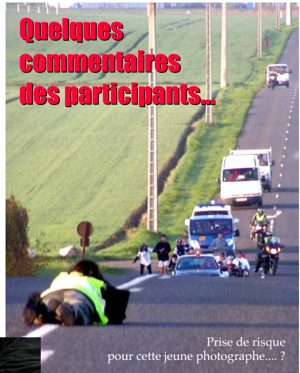
Prise de risque pour cette jeune photographe... ?