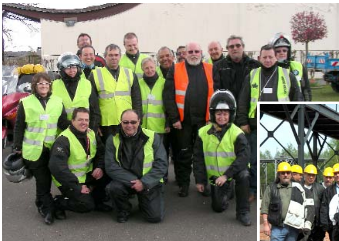
6 e Relais Handisport, les 12 & 13 avril page 5