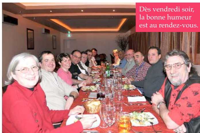
Dès vendredi soir, la bonne humeur est au rendez-vous.