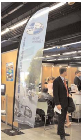
La salon p.3