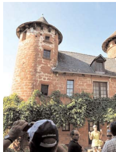
Le Lot p.5