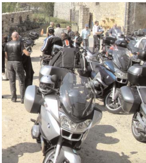
Café Racer p.4