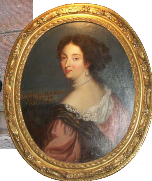
Noces Secrètes au Château de Maintenon - p. 4