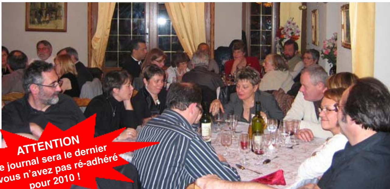
Fête du Club p. 3