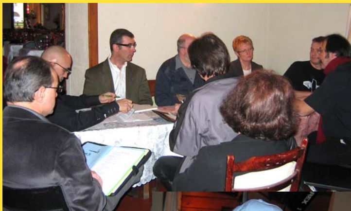
▲ Le Bureau en plein travail...

Prochaine réunion : le samedi 13 février