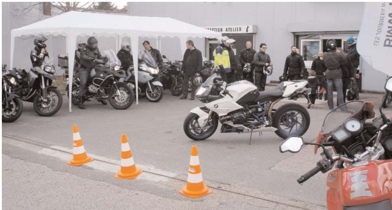
Portes ouvertes chez CMC p. 3